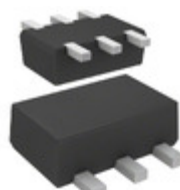
DMC564030R Panasonic Electronic Components TRANS PREBIAS DUAL NPN SMINI6