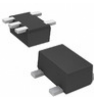
DMC5610N0R Panasonic Electronic Components TRANS 2NPN PREBIAS 0.15W SMINI5